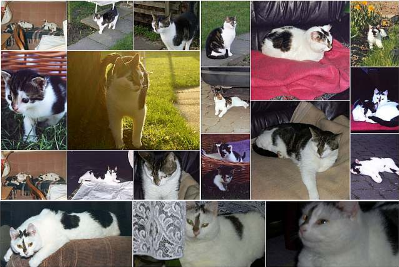
Die zum Laminieren fertig vorbereitete Vorlage.

Qualität in diesem Fall nicht . Das so angefertigte Tischset ist ein immer wieder gerne gesehenes, individuelles Geschenk für wenig Geld. Daneben besteht auch noch die Möglichkeit (da derartige Tischsets aufgrund der Laminierung starr werden), mittels Locher an allen vier Ecken Löcher zu stanzen, um mehrere mit Bändern verbundene Tischsets untereinander als Wandschmuck aufzuhängen.