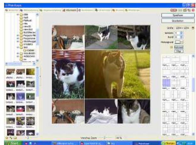
Schritt 1 (Schritt 2 erfolgt in gleicher Weise)

Beachten: Je nach gewählten Layouts der Schritte 1 und 2 werden pro Tischset etwa 35 bis 50 Fotos benötigt. Die sollten zuvor bereits vorbereitet und zwecks besserer Übersicht in einem separaten Ordner abgespeichert worden sein. Die Tischsetvorlage selbst kann zwar ein komprimiertes JPG sein, doch empfiehlt sich die Komprimierung zwecks bestmöglicher