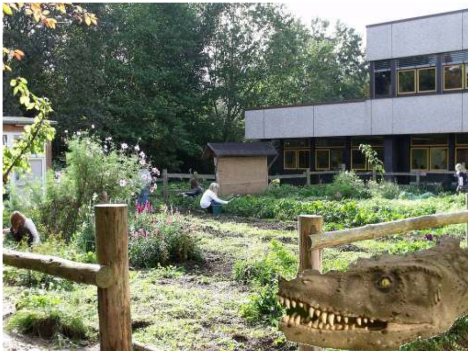
Die fertige Montage